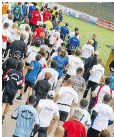
Beim ersten Mittelbayerische Landkreislaf im vergangenen Jahr gingen 1500 Teilnehmer an den Start.