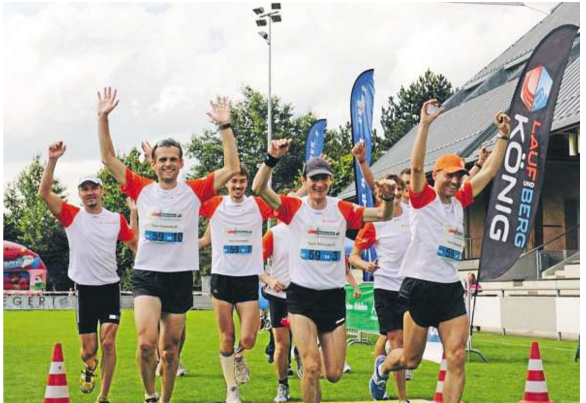
So sehen Sieger aus: Das Team „Sonnenkraft“ rannte im vergangenen Jahr als erstes durchs Ziel.

Die Startgelder gehen zur Hälfte an die Vereine, die die Helfer in den Etappenorten stellen – und natürlich auch