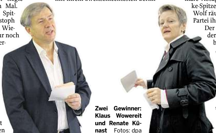
Zwei Gewinner: Klaus Wowereit und Renate Künast Fotos: dpa

Pleiten geprägte Superwahljahr. Die Grünen, die sich mit ihrer Spitzenkandidatin Renate Künast wegen exzellenter Umfragewerte lange Zeit Hoffnung auf den Posten des Regierungschefs gemacht hatten, können allenfalls Juniorpartner der SPD werden. Künast hat angekündigt, dass sie in diesem Fall Chefin der Bundestagsfraktion bleiben will. Die Linke muss mit ihrem zweitschlechtesten Berlin-